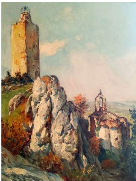
La tour de Simiane

Dans le même temps, l'archevêque avait été sollicité de donner son autorisation pour célébrer les offices religieux dans un autre lieu de culte à partir du moment où l'église serait démolie.